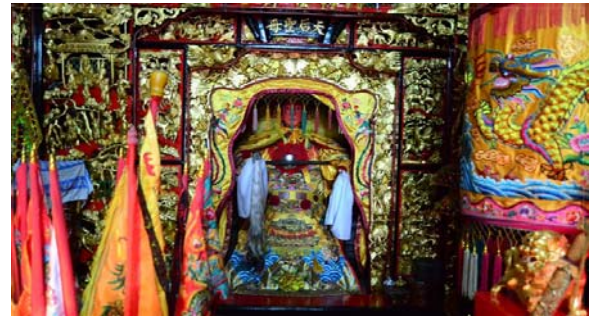
ไฮตังมา (เจ้าแม่ทับทิม)