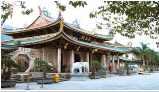
วัดหนานผู่ถั่ว