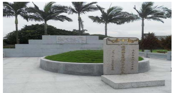
ปายสุสานพระเจ้าตาก