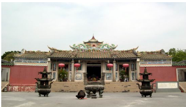
วัดไคหวาน