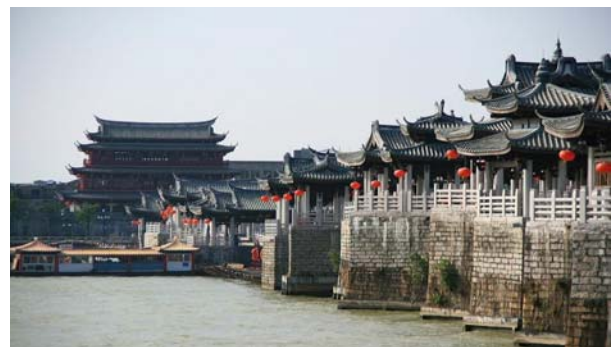
สะพานและประตูเมือง