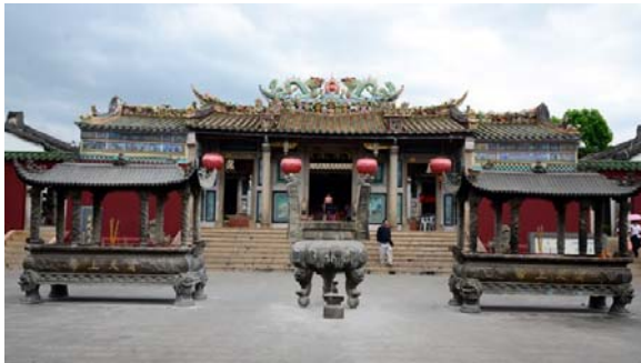
เจียงปู้ซั่ว