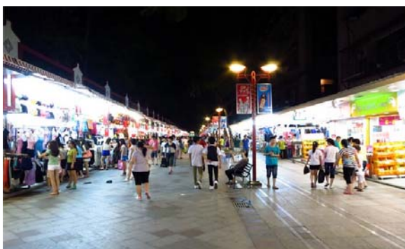
ถนนคนเดินชัวเถา