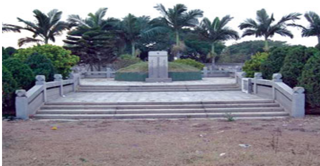
สุสานพระเจ้าตาก