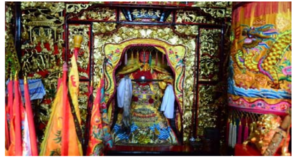
ไฮตังมา (เจ้าแม่ทับทิม)